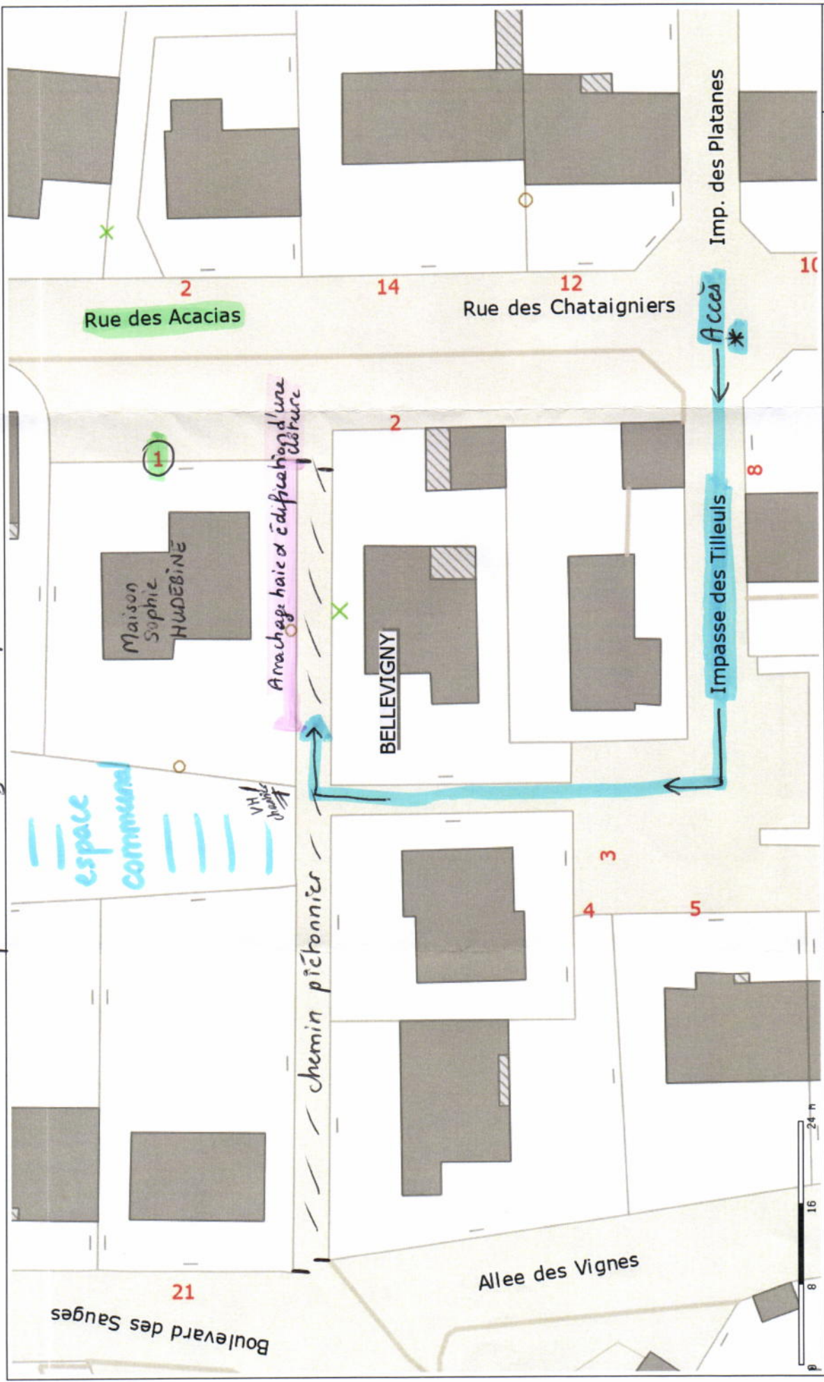
Plan de masse au 1 / 500 ème